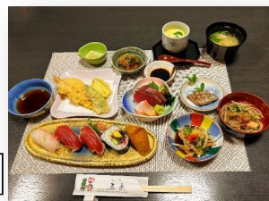
枕崎 すし匠五条 イメージ写真